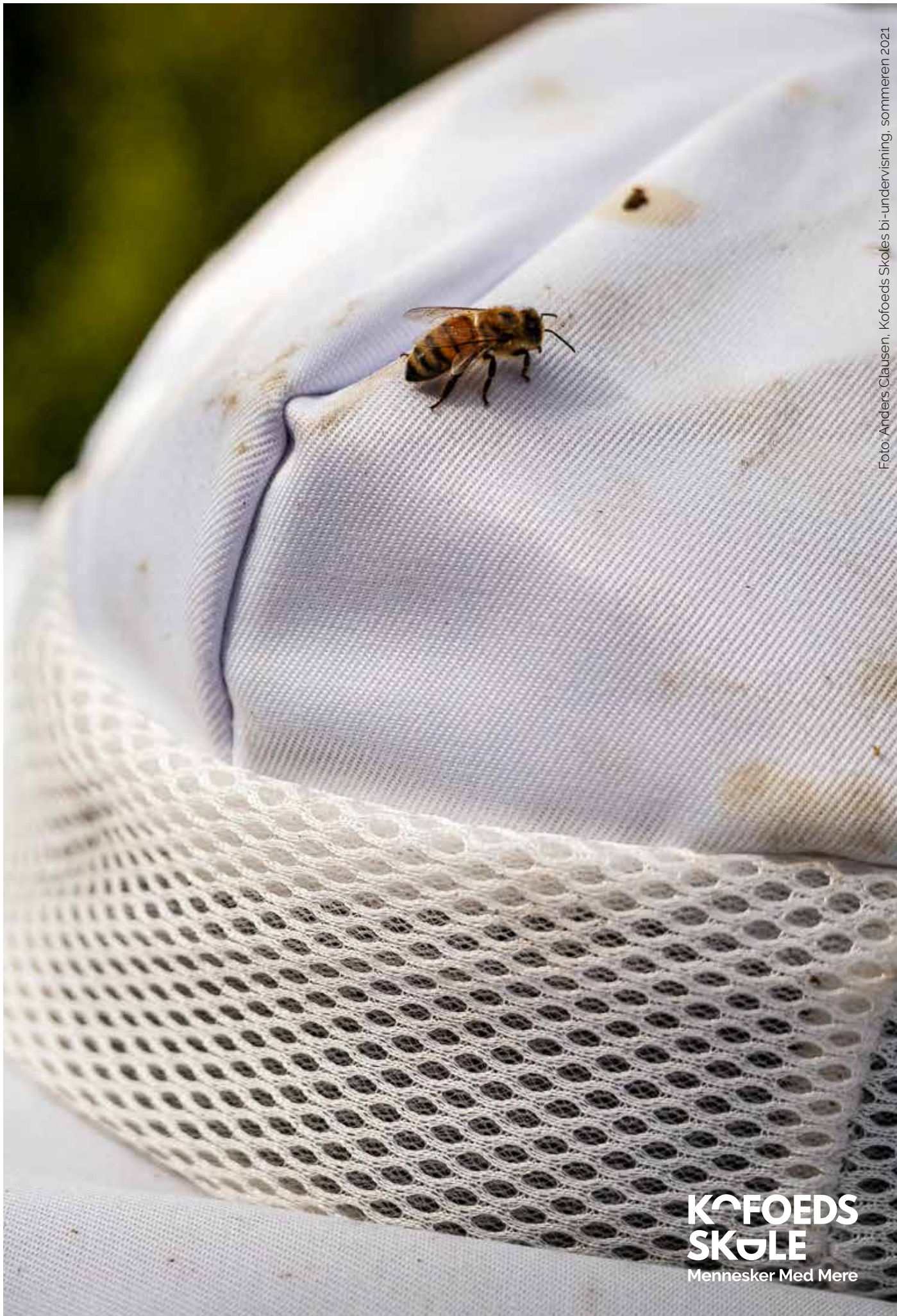
Koføeds Skoles bi-undervisning, sommeren 2021